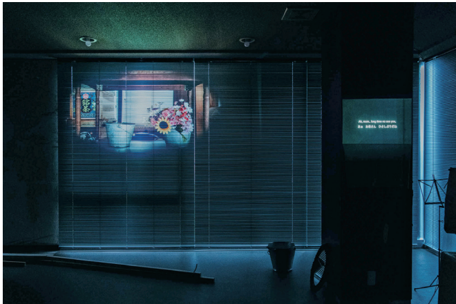
↑《石巻13分》2021年