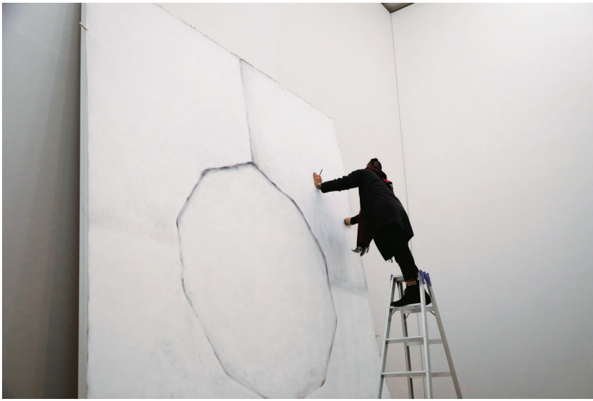
↑《スワンソングAのために》2018年