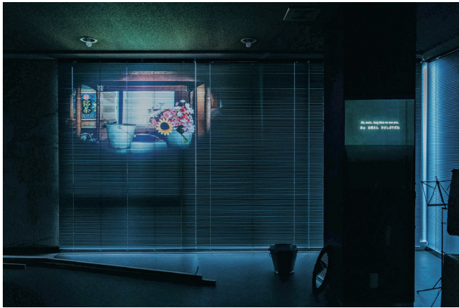
↑《石巻13分》2021年