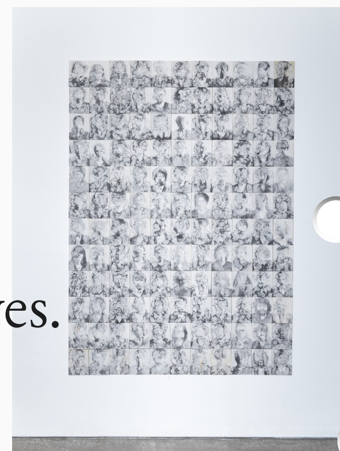
《隠滅の作法 #1~132》 2022年