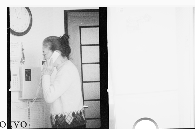
《母, 13時3分前》 2022年