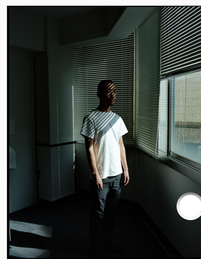
《M, ME》 2022年