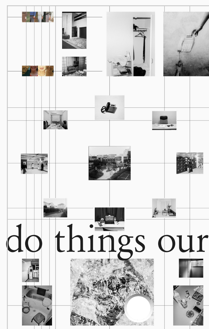
《Eco System》 2022年