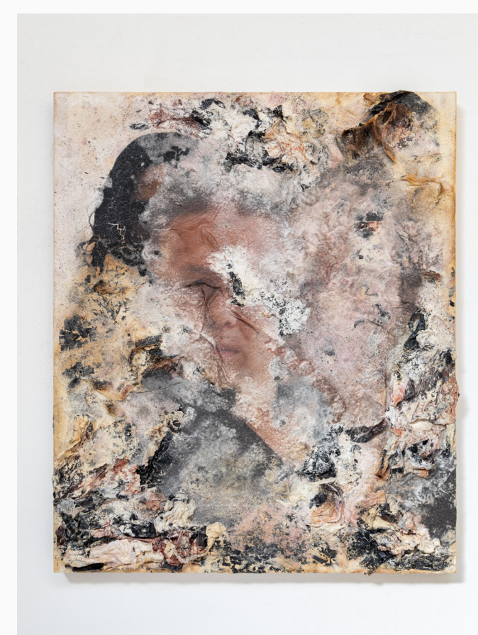
《まず、自分でやってみる。(A)》 2023年