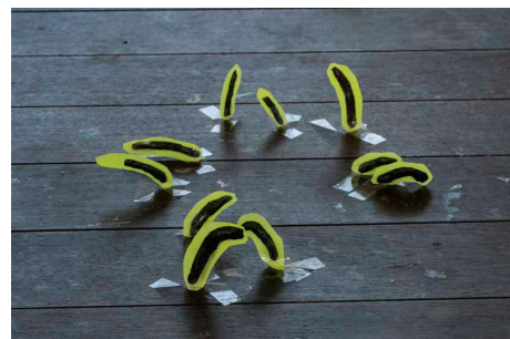
《光り輝くねこじゃらし》2022年