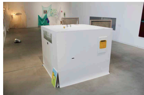
第1回BUG Art Award ファイナリスト展 展示風景「対岸は見えない」2024年