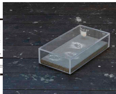
《恐竜を襲うウニ》2022年