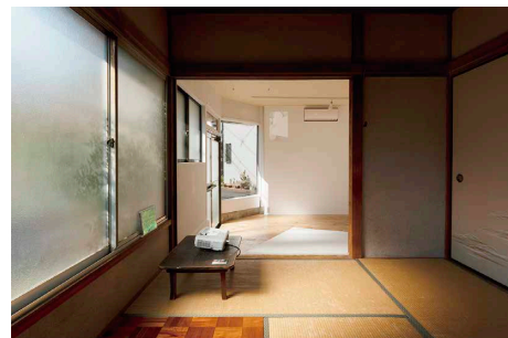
展示風景「リンクスケーター」2023年