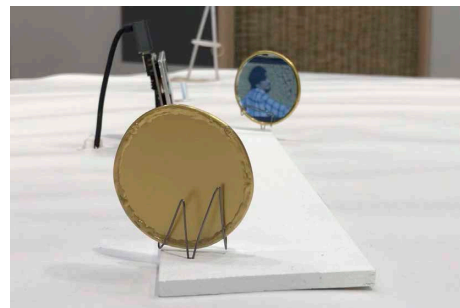
《はやいぬ》2024年