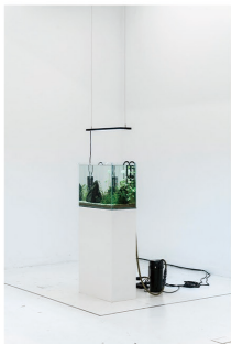
《帝國水槽》 2022 熱帯魚 (エンペラーテトラ、ヌマエビ、水櫃、水草、山水石、砂、LED ライト、濾過装置、CO2 ボンベ、満洲水草図譜)

1993 年生まれ。愛知県在住。 爬虫類や両生類の飼育経験を基に、身体を取り巻く諸規範の矛盾を露呈させたり、生態系の循環システムに人間を組み込む方法を考えたりしている。2020 年から住所非公開スペース「IN SITU」の運営にも携わっている。 主な展覧会に「D.L.P.」(箔一ビル / 2023)、「神 (analyzer)」(IN SITU / 2023)、「DAZZLER」(京都芸術センター / 2022)、「群馬青年ビエンナーレ 2021」(群馬県立近代美術館 / 2021) など。