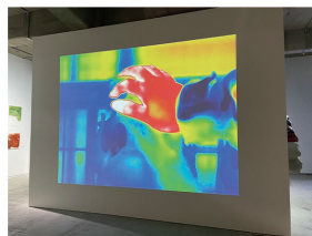
《ガイ / GA-I》 2023