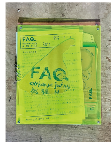
FAQ? 交換日記 2023

現在まで、レーザーアニメーションを使用した VJ パフォーマーとしても活躍し、音楽ジャンルを問わずサウンドアーティストや DJ 等とコラボレートし舞台演出を担っている。近年はパーティー「REVOLIC -revolution holic / 革命中毒-」のオーガナイズ実践も行う。