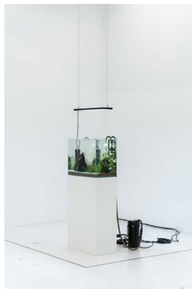
《帝國水槽》2022年 熱帯魚(エンペラーテトラ)、 ヌマエビ、水槽、水草、山水石、 砂、LEDライト、濾過装置、 CO2ポンプ、『満州水草図譜』 撮影:守屋友樹