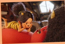
『ONI ~ 神々山のおなり』

ピクサーでアートディレクターを務めていた堤大介とロバート・コンドウが、2014年に短編映画『ダム・キーパー』を共同監督したことをきっかけに、2014年7月にカリフォルニア州パークレーに共同設立したアニメーションスタジオ。『ダム・キーパー』は2015年に第87回アカデミー賞短編アニメーション賞にノミネートされたほか、世界各地で25の賞を受賞、75の映画祭で上映された。2016年制作の短編映画『ムーム』は世界8カ国の映画祭で数々の賞を受賞。2017年、日本のHuluで配信されたエリック・オー監督の『ピッグ - 丘の上のダム・キーパー』は、配信後にNHKでも放送された人気作品。Netflixで配信中の『ONI ~ 神々山のおなり』は、2023年に“アニメーション界のアカデミー賞”と称されるアニメー賞にて二部門受賞し、米テレビ界最高峰の栄誉といわれるエミー賞でも三部門で受賞。2019年からは石川県金沢市にもスタジオを構え、日米の2拠点で作品を制作している。作品制作以外にも展覧会やイベント、ワークショップの開催など多角的に活動している。