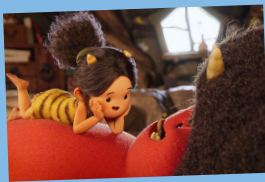
『ONI ~ 神々山のおなり』

ピクサーでアートディレクターを務めていた堤大介とロバート・コンドウが、2014年に短編映画『ダム・キーパー』を共同監督したことをきっかけに、2014年7月にカリフォルニア州パークレーに共同設立したアニメーションスタジオ。『ダム・キーパー』は2015年に第87回アカデミー賞短編アニメーション賞にノミネートされたほか、世界各地で25の賞を受賞、75の映画祭で上映された。2016年制作の短編映画『ムーム』は世界8カ国の映画祭で数々の賞を受賞。2017年、日本のHuluで配信されたエリック・オー監督の『ピッグ-丘の上のダム・キーパー』は、配信後にNHKでも放送された人気作品。Netflixで配信中の『ONI ~ 神々山のおなり』は、2023年に“アニメーション界のアカデミー賞”と称されるアニメー賞にて二部門受賞し、米テレビ界最高峰の栄誉といわれるエミー賞でも三部門で受賞。2019年からは石川県金沢市にもスタジオを構え、日米の2拠点で作品を制作している。作品制作以外にも展覧会やイベント、ワークショップの開催など多角的に活動している。